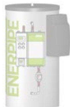
ÜPZL mit Frischwasserstation und Ultraschall-Wärmemengenzähler